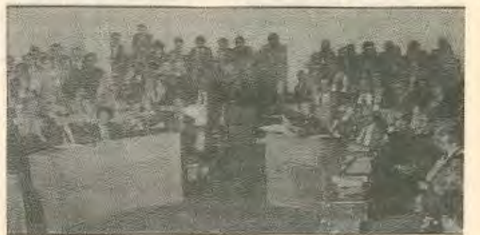
Απο τη ψηφοφορία για ανάδειξη προέδρου της βουλής.

Η προσπάθεια των αστων για πέραςμα των μέτρων λιτότητας είναι σί-